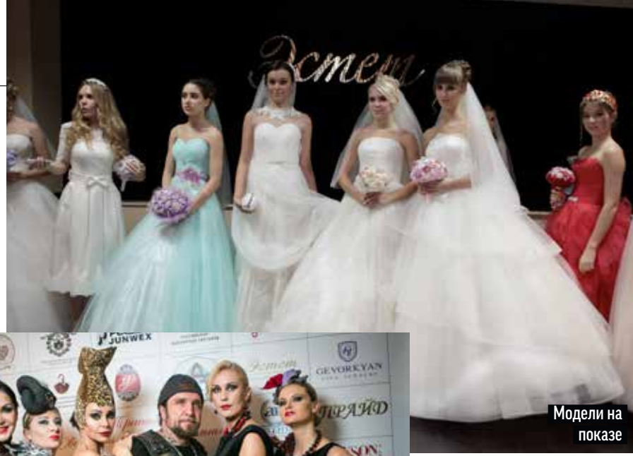
Модели на показе