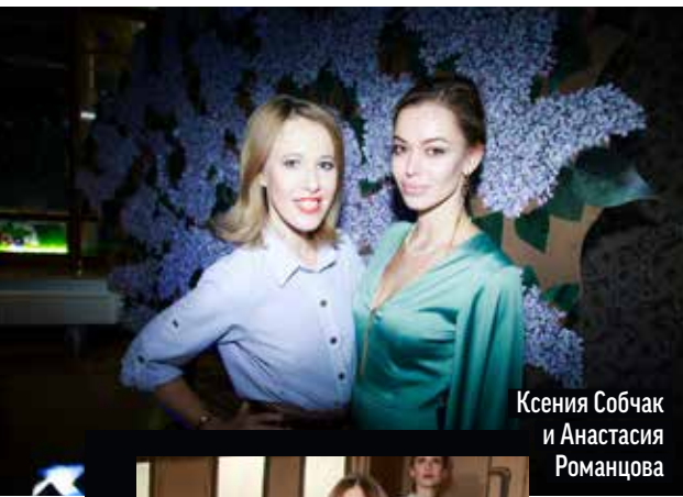
Ксения Собчак и Анастасия Романцова

В гостинице «Метрополь» – при поддержке телеканала «Домашний» прошла презентация коллекции A La Russe Anastasia Romantsova весна-лето 2016. В рамках показа исторические залы отеля превратились в миниатюрные театры, актерами которых стали модели, а декорациями - аппликационные картонные инсталляции.