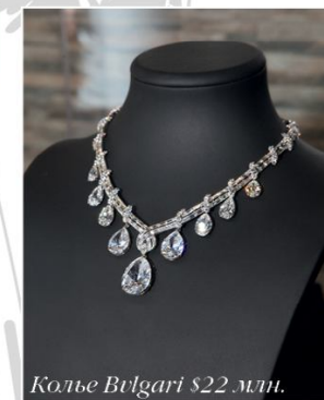
Колье Bvlgari $22 млн.

Почетным гостем Estet Fashion Week стал болгарский, советский и российский певец, Народный артист Болгарии, Народный артист России Бедрос Киркоров , который торжественно открыл череду модных показов 21 марта сольным выступлением.