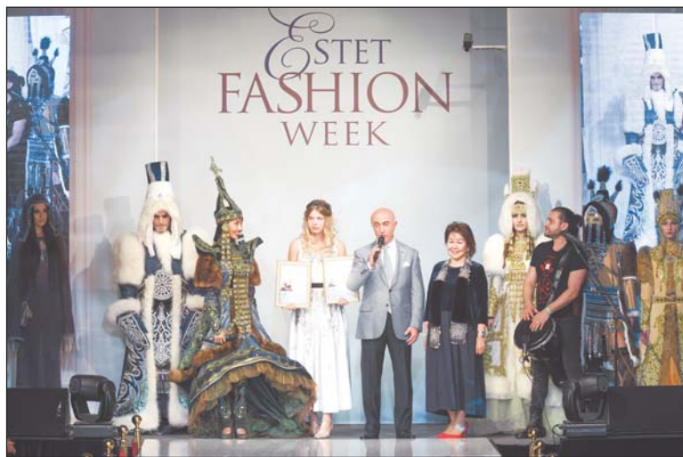
«Лучшая ювелирная коллекция» – «Киэрге»